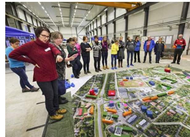
Proyecto innovador de servicios públicos bajos en carbono (li, Finalndia)