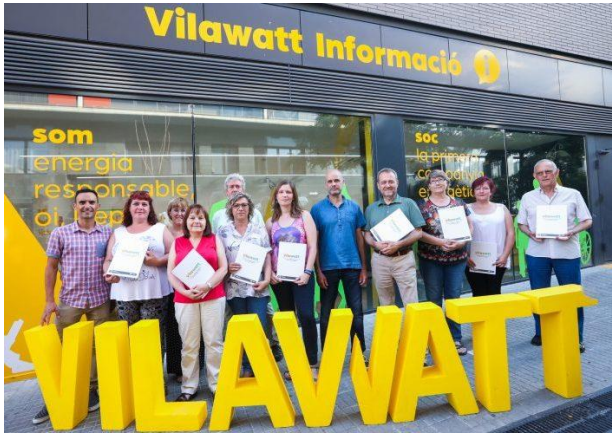
Vilawatt - Innovadora asociación público-privada-ciudadana local para la gobernanza energética (Acciones Urbanas Innovadores – UIA , Viladecans, España)