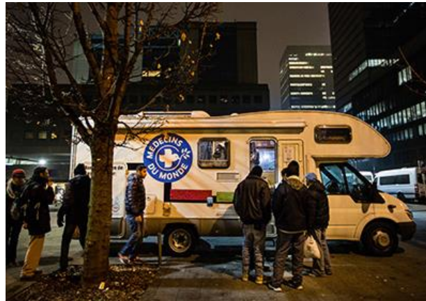
Centros Sociales y de Salud Integrados (Bruselas, Bélgica)