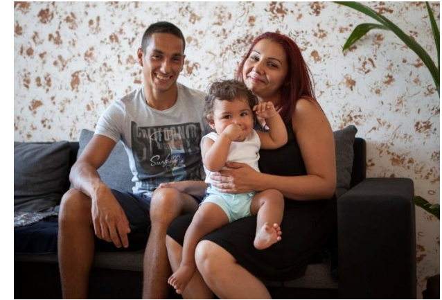
Proyecto “Housing First” - Poner fin a la falta de vivienda familiar (Brno, Chequia)