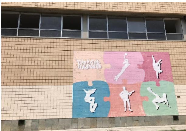
Proyecto Co-City - gestión colaborativa de los bienes comunes urbanos para contrarrestar la pobreza y la polarización socioespacial (Acciones Urbanas Innovadores – UIA , Turín, Italia)