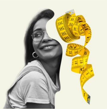
Design and fashion