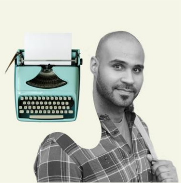
Literature and Publishing